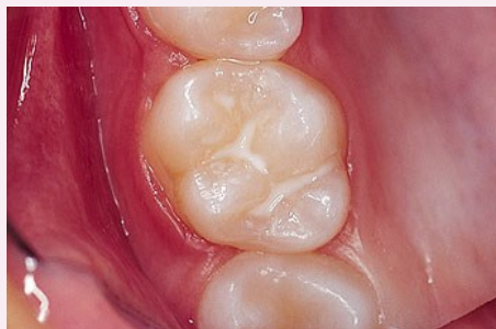
Schutz vor Karies: Versiegelung der feinen Grübchen auf der Kaufläche

Bei der Versiegelung werden die Fissuren mit einem hellen Kunststoff dauerhaft verschlossen, so dass an diesen Stellen keine Karies mehr entstehen kann (siehe Abb. unten).